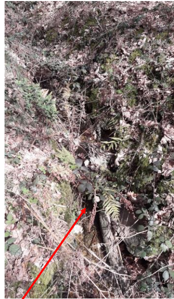
Localisation et vue de l'écoulement de la Verrerie