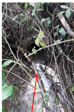
Vue de la source du cours d'eau