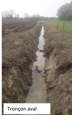
Localisation de l'écoulement de Bihalais