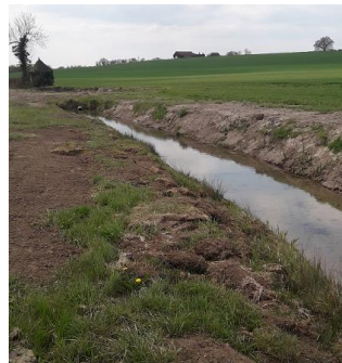
Localisation et vues des différents tronçons proposés au reclassement sur le secteur des Moutonnières