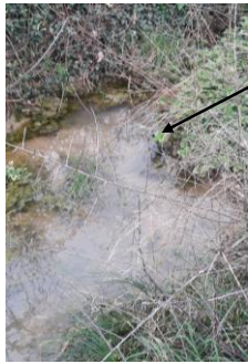
Localisation et vue du tronçon proposé au déclassement