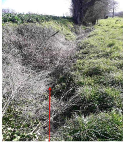
Localisation et vue de l'ancien bief du Moulin de Saint-Père