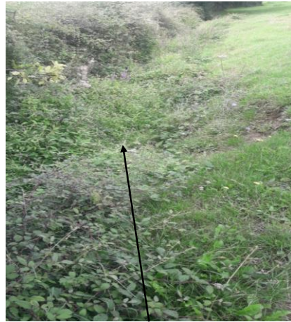
Localisation et vue de l'écoulement expertisé