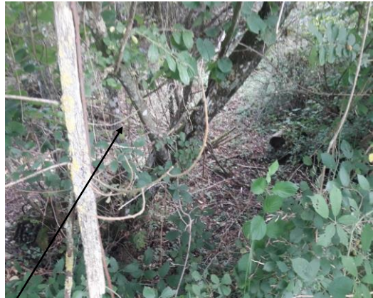
Localisation et vue de l'écoulement expertisé