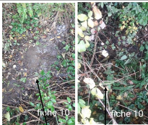
Localisation et vue du tronçon expertisé