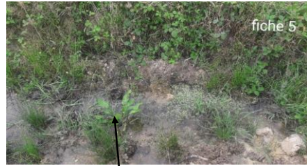
Localisation et vue du tronçon expertisé