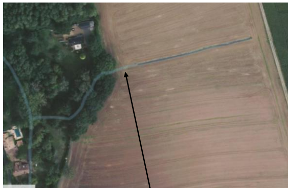
Portion de cours d'eau busée (en vert sur le plan)