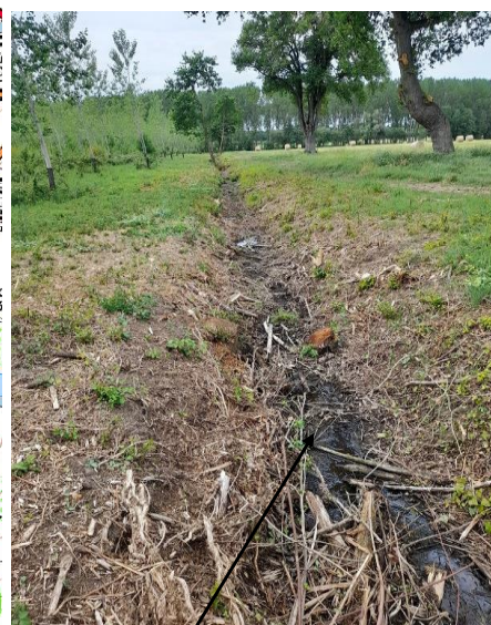
Localisation et vue du tronçon expertisé