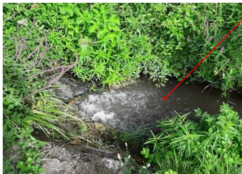
Localisation et vue du tronçon expertisé