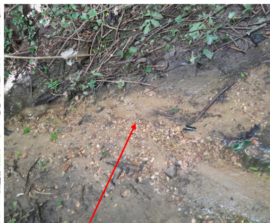
Localisation et vue du tronçon expertisé