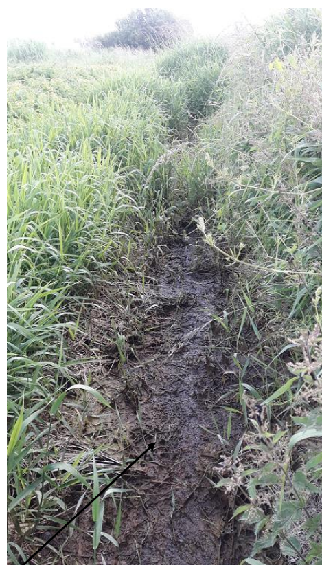
Localisation et vue de l'écoulement expertisé