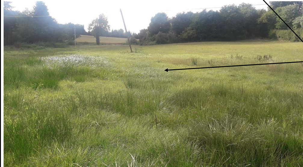
Localisation et vue de l'écoulement expertisé