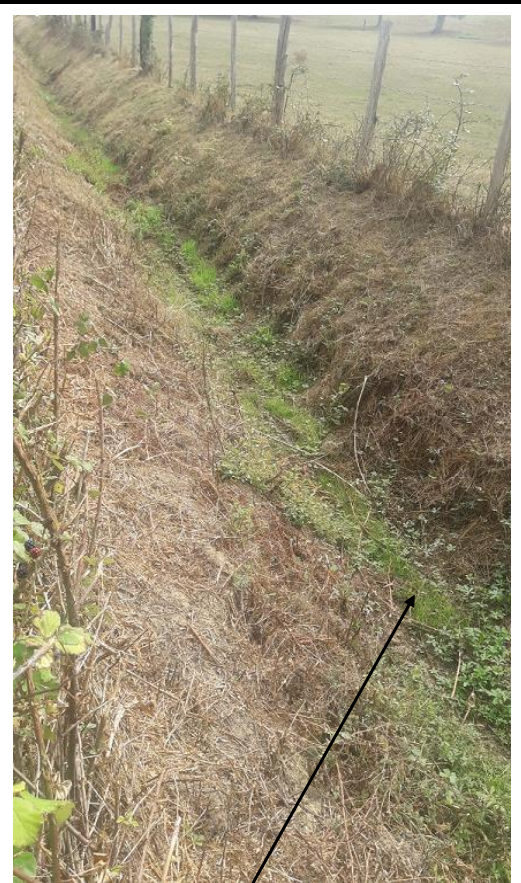
Localisation et vue de l'écoulement expertisé