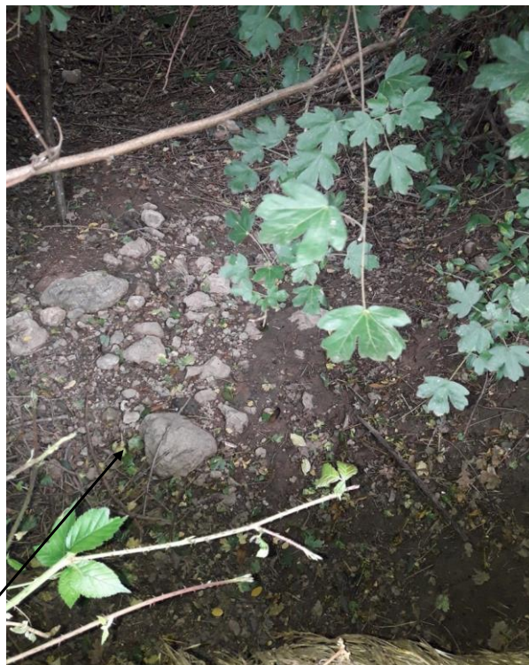
Localisation et vue du tronçon expertisé