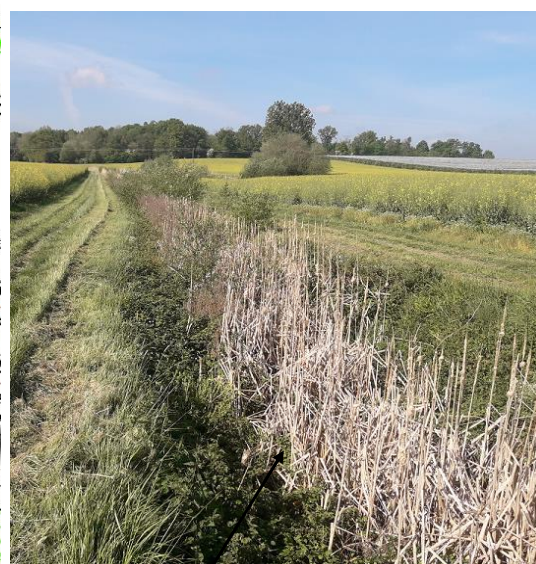
Localisation et vue du tronçon expertisé