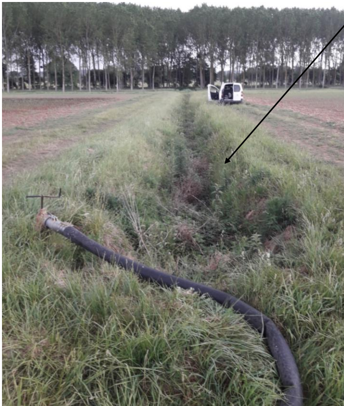
Localisation des tronçons expertisés