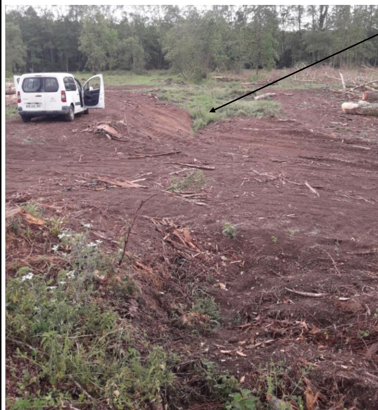
Localisation des tronçons expertisés