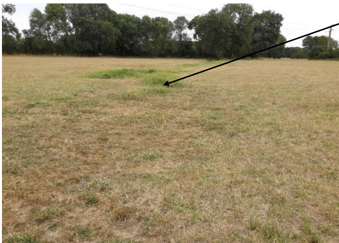
Localisation et vue du tronçon expertisé