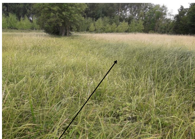
Localisation et vue du tronçon expertisé