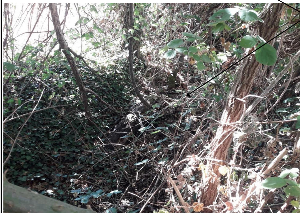
Localisation et vue du tronçon expertisé