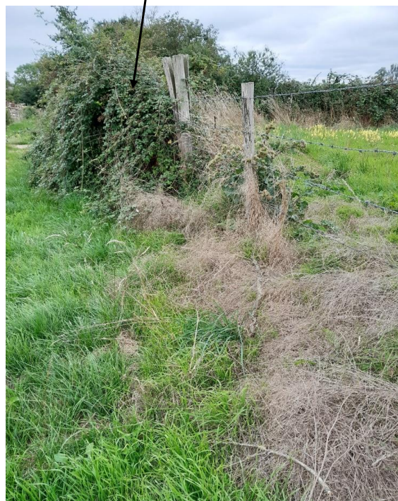
Localisations et vues des écoulements expertisés