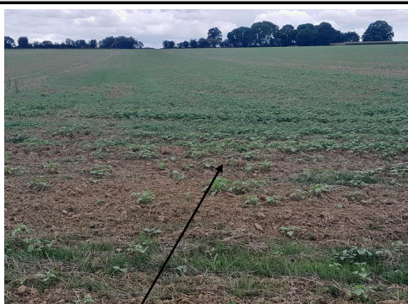
Localisation et vue du tronçon expertisé