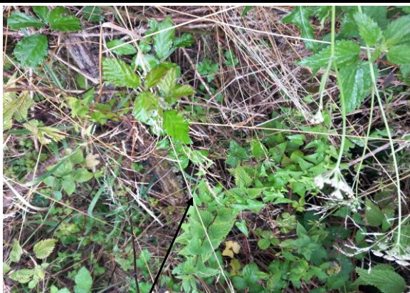
Localisation et vue du tronçon expertisé