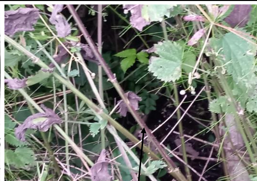
Localisation et vue du tronçon expertisé