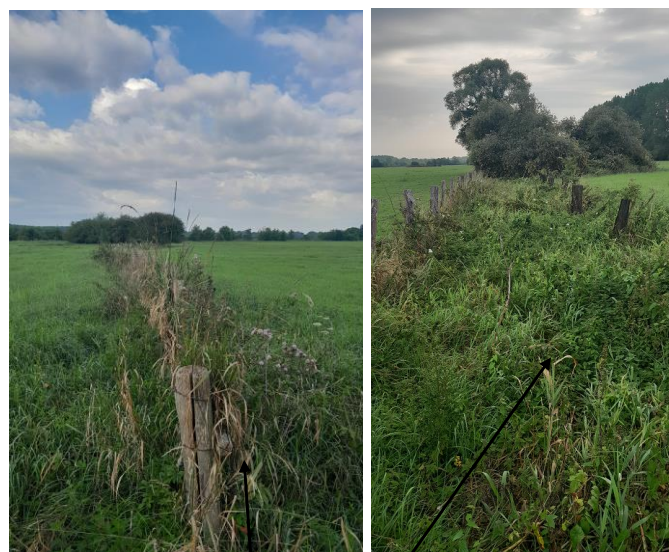
Localisation et vue du tronçon expertisé