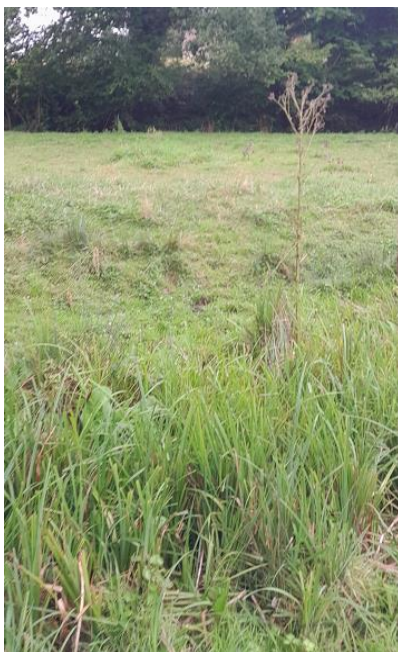
Localisation et vue de l'écoulement expertisé