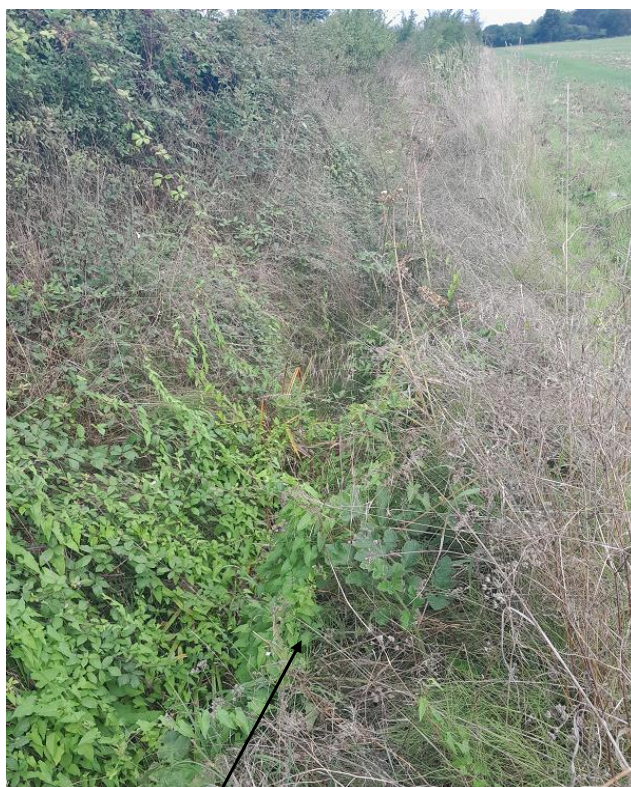
Localisation et vue de l'écoulement expertisé