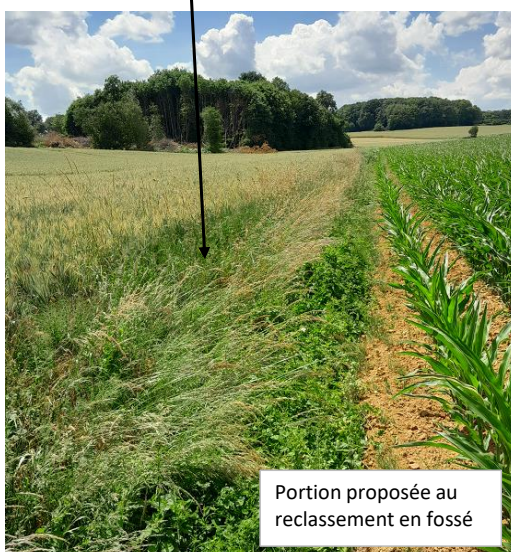
Portion proposée au reclassement en fossé