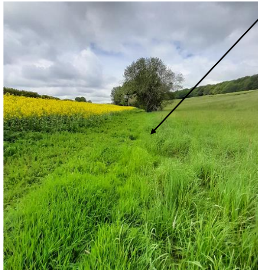
Localisation et vue de l'écoulement expertisé