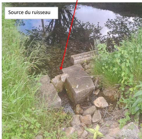
Source du ruisseau