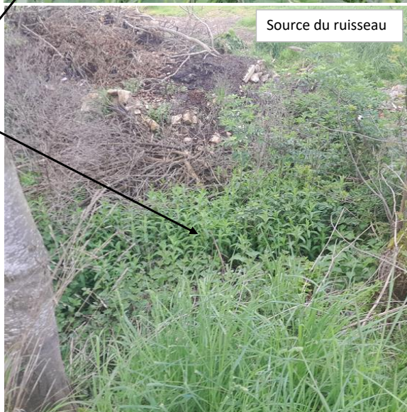
Localisation et vue du tronçon expertisé