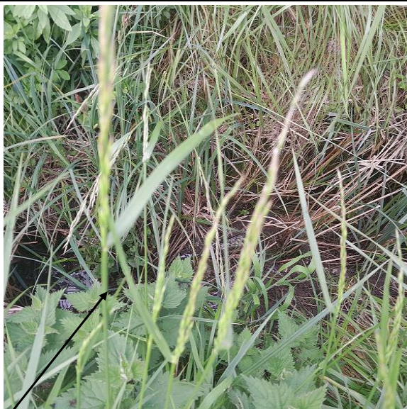
Source du ruisseau