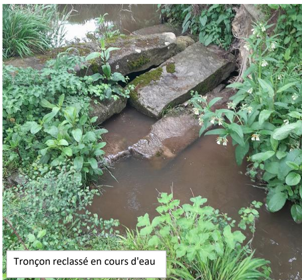
Tronçon reclassé en cours d'eau