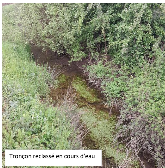
Tronçon reclassé en cours d'eau