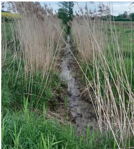
Localisation et vue des tronçons expertisés