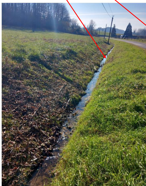
Photographie n°2 : Le cours d'eau