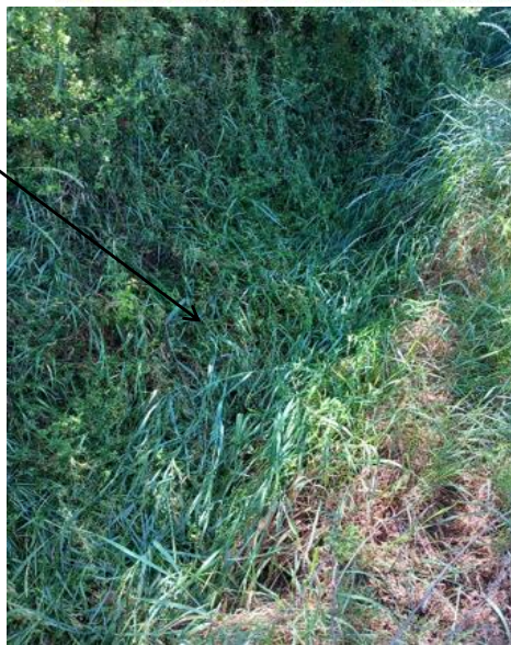
Localisation et vue du tronçon expertisé