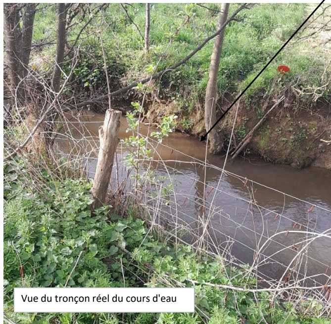
Vue du tronçon réel du cours d'eau

Localisation et vue de l'écoulement expertisé