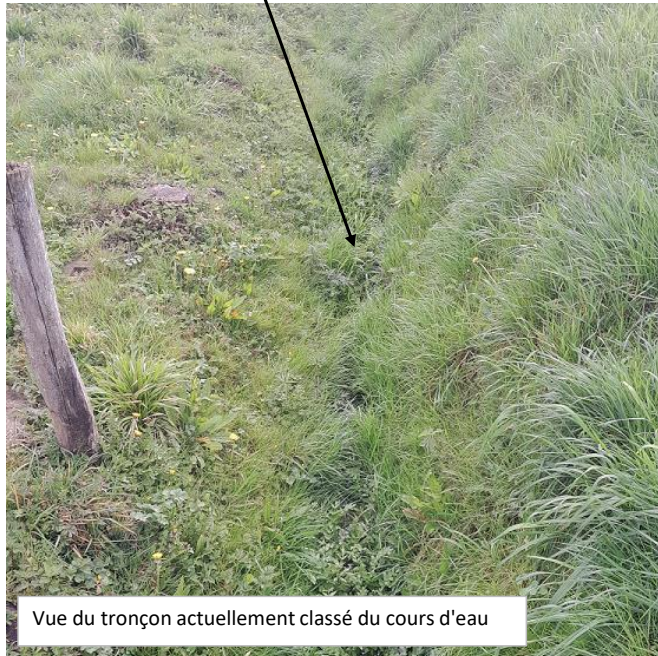
Vue du tronçon actuellement classé du cours d'eau