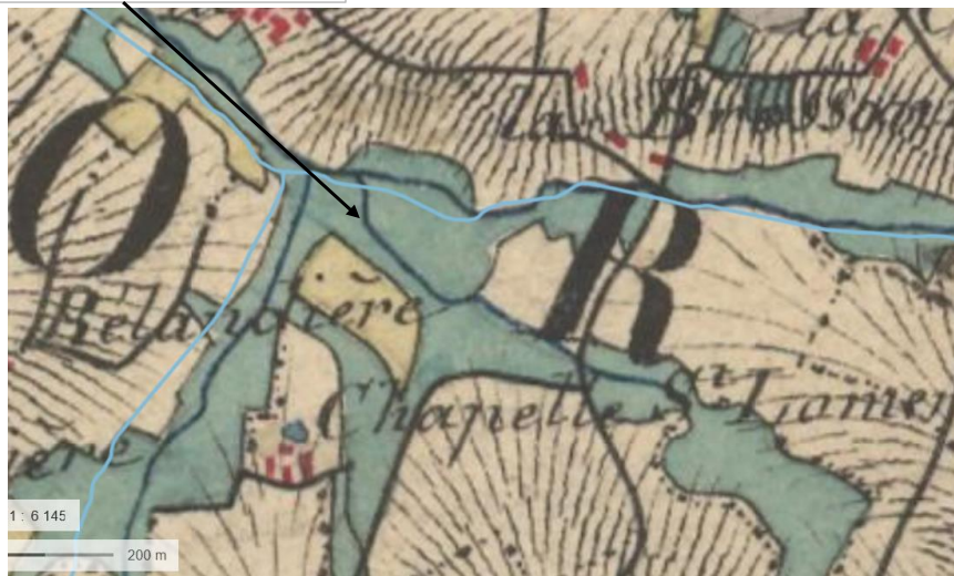
Localisation et vue du tronçon expertisé