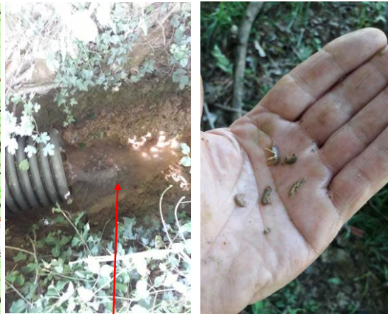
Localisation et vue du tronçon de la Mousserie