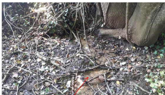
Localisation et vue de la source du tronçon de Valaubrun