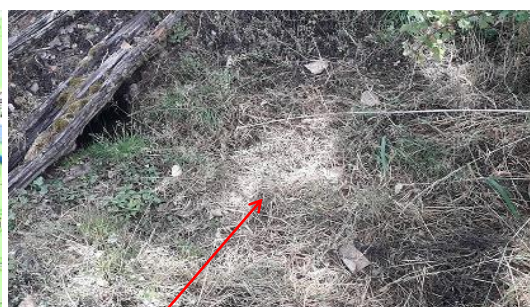
Localisation et vue du fossé provenant du lieu-dit "Toupentier"