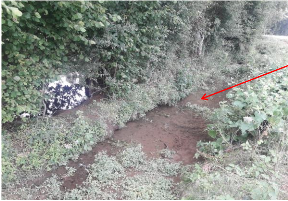
Localisation et vue de l'écoulement du Champ de Pierre