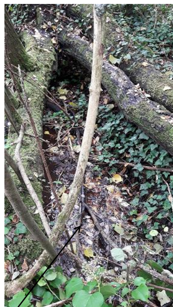
Localisation et vue de l'écoulement de la Marquerie