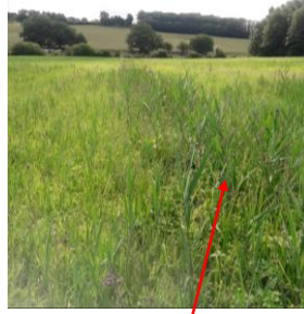
Localisation et vues des écoulements d'Arthé