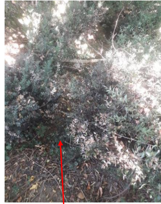
Localisation et vue de l'écoulement de la Maison Neuve