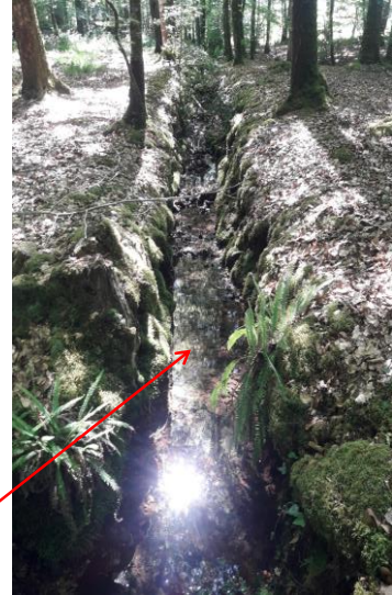
Localisation et vue des sources du ruisseau de la Fontaine des Roches