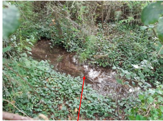
Localisation et vue du ru de la Terrinière